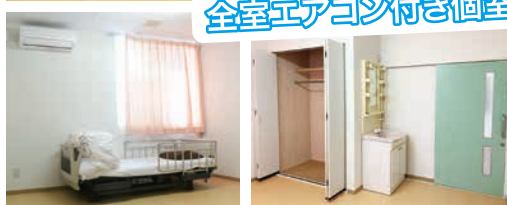
全室エアコン付き個室